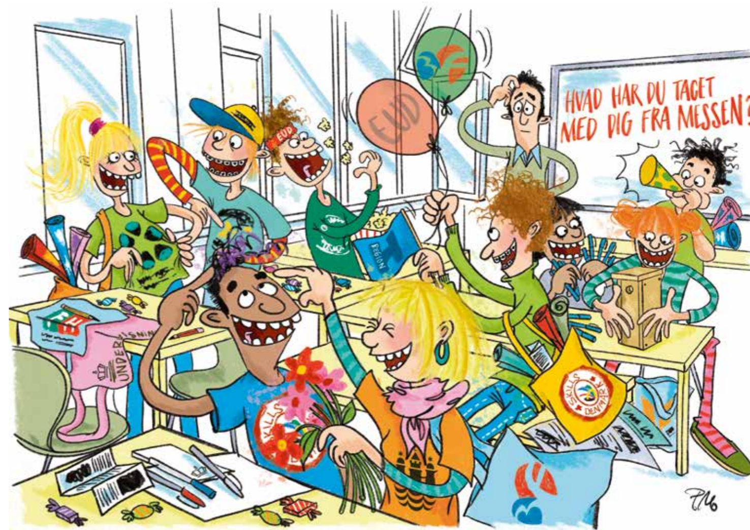
ILLUSTRATION FRA KAMPAGNEMATERIALET VED ÅRETS DM I SKILLS

»Vores opgave er at skabe øget fokus på erhvervsuddannelserne og det gode håndværk for dermed at styrke rekrutteringen og talentudviklingen. Det blev indfriet gennem DM i Skills. Desuden har vi jo aktiviteter som Skills-landsholdet til WorldSkills og EuroSkills. Desuden viser vi med Skills Stafetten årligt 50-60.000 8. klasses-elever, hvilken glæde der ligger i at arbejde med hænder og hoved, og endelig arbejder vi på at systematisere de skolekonkurrencer og regionale